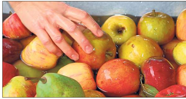
Zunächst werden die Äpfel in einem Wasserbad vorgereinigt. Dann werden sie automatisch in den Häcksler transportiert.